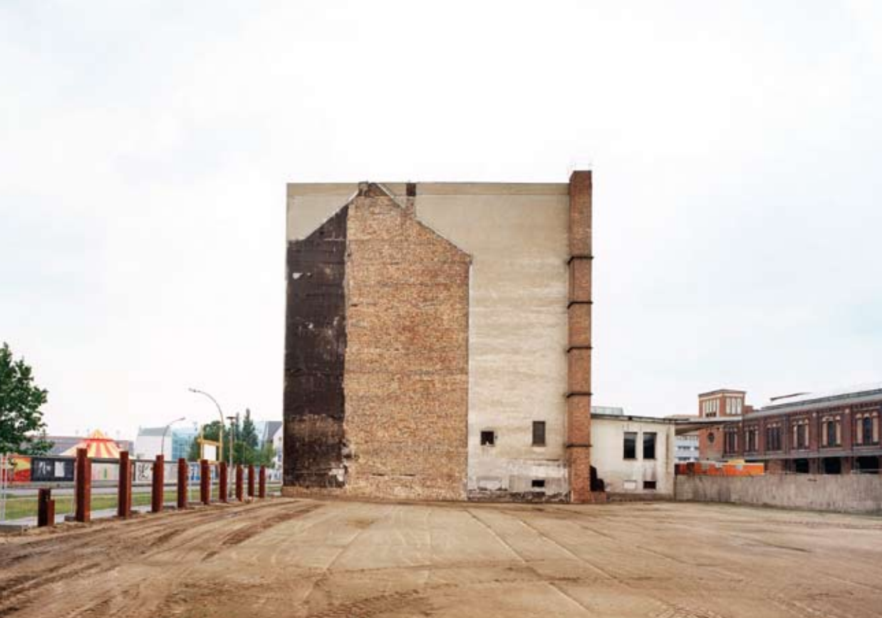
© PATRICK TOURNEDEUF, TRACES, BERLIN '01, 2004