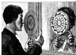
02 / © PHÉNAKISTOSCOPE, SOURCE LIFEPROOF.FR