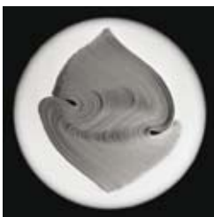
05 / © HENRI GAUD, SÉRIE BLANCS & PAPIERS, 1977