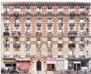
01 / © GILLES LEINDORFER, PARIS FAÇADES, 2010