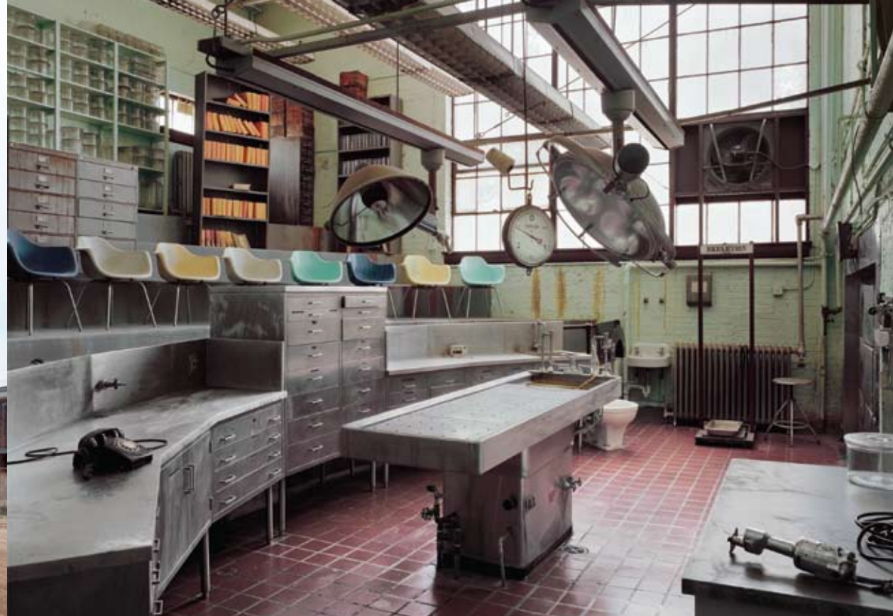
AUTOPSY THEATER, ST. ELIZABETH'S HOSPITAL, WASHINGTON DC, 2005