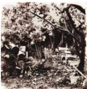
03 / © CAMILLE BONNEFOI, SANS TITRE, 2011