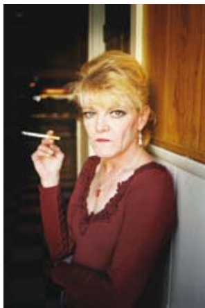
04 / © RICHARD PAK, KRYSAL CHRIST, SÉRIE PURSUIT, 2009