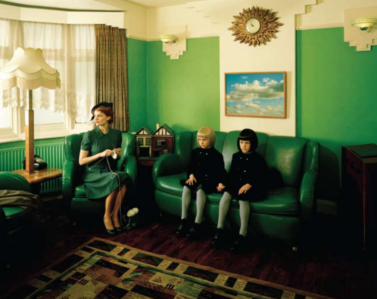
© LOTTIE DAVIES, VIOLA AS TWINS, MEMORIES AND NIGHTMARES, 2009

" Memories and Nightmares a pour sujet les cauchemars et les souvenirs de la petite enfance ainsi que de la construction de l'identité au travers d'univers personnels et de leur narration.