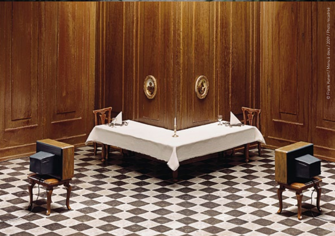
© Frank Kunert / Menu à deux / 2009 / Photo recadrée