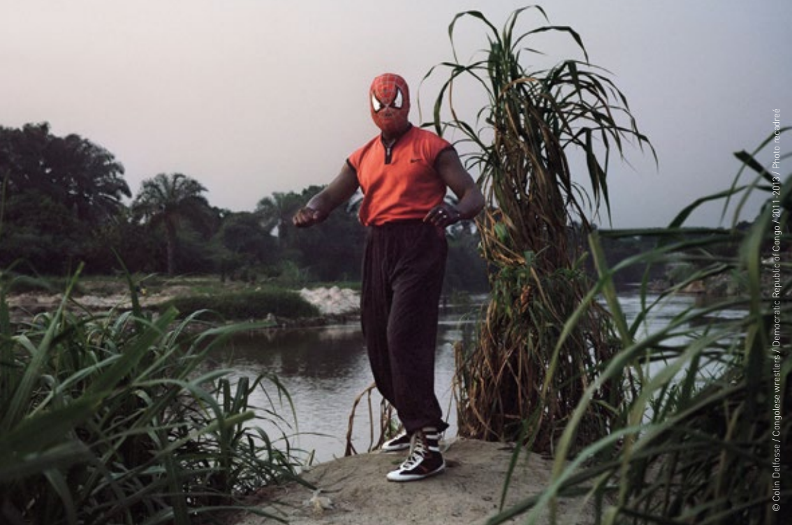
Congolese wrestlers / Democratic Republic of Congo / 2011-2013 / Photo recadrée