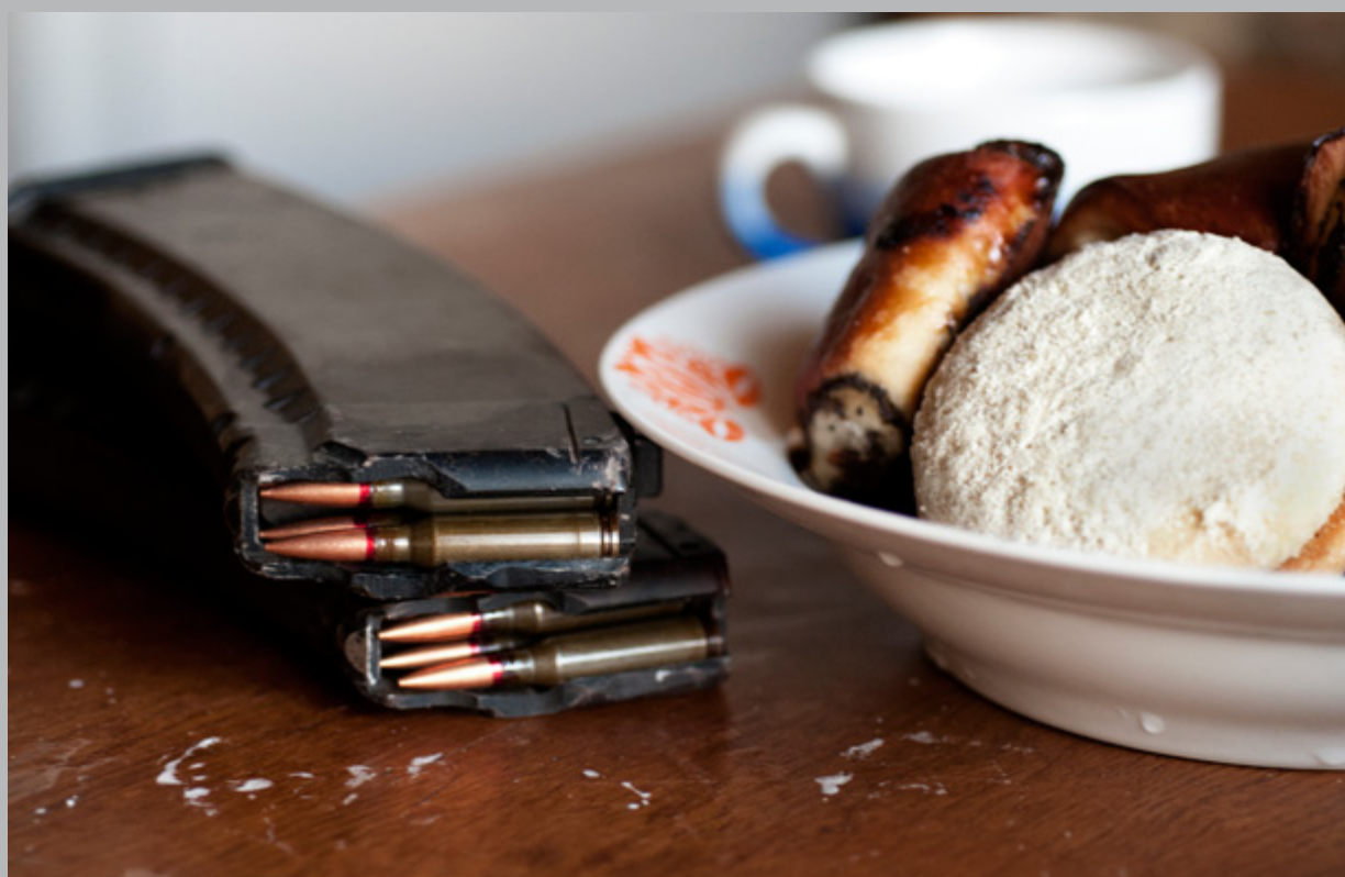
Donbass, guerre épaisse , Ukraine, 2015

AVEC LE SOUTIEN DU CRÉDIT AGRICOLE ALSACE VOSGES, DE LA RÉGION ALSACE ET DE LA DRAC ALSACE