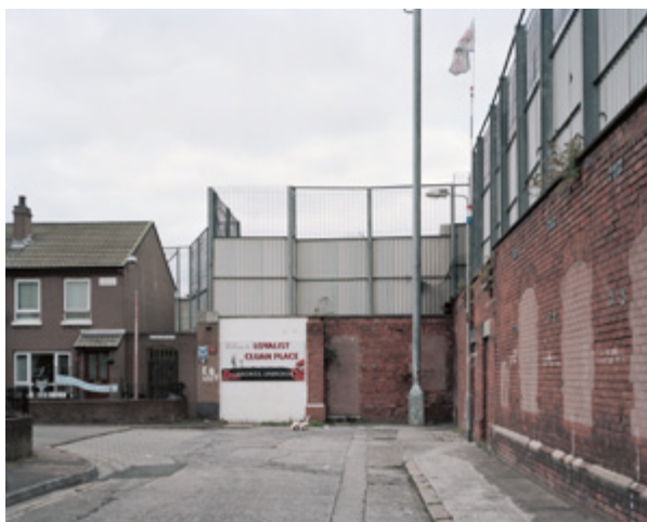
9 photos, vidéos et publication