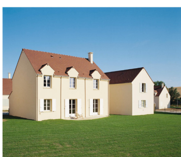
Alain Bublex, Arrêts soudains, Une demie-heure entre Dan Graham et Thomas Demand (détail), 2002 épreuves chromogènes, séquence de 12 photographie : chacune 77 x 80 cm, édition de 2 (série indivisible), collection du musée d'Art moderne de la Ville de Paris