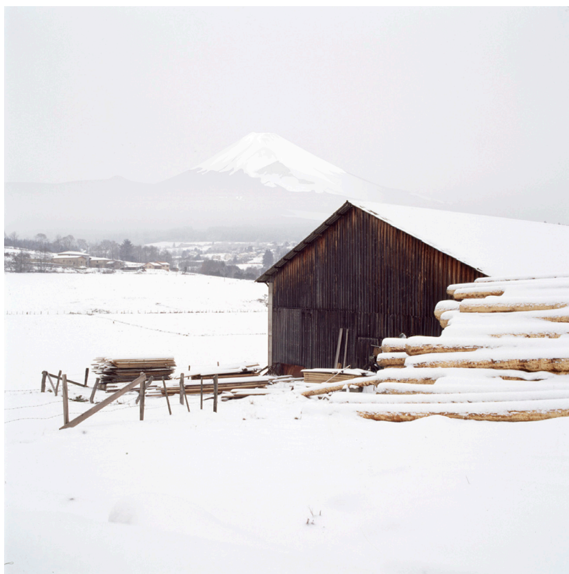
Alain Bublex, Paysage 76 (Fuji neige I) , 2010, épreuve aux encres pigmentaires sur papier, 145 x 145 cm, édition de 3

Dans la série présentée à La Chambre, le sommet immaculé au loin rappelle le toit enneigé du premier plan. Bublex s'amuse avec les formes et les contrastes. Il crée des trompes-l'oeil oniriques qui nous invitent à repenser notre rapport aux paysages de notre quotidien.