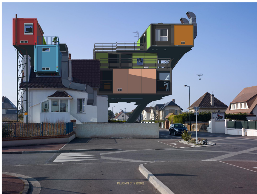
Alain Bublex, Plug-in City 2000, Un weekend à la Mer 2, 2012

Une image très grand format (180 cm x 240 cm) est exposée à l'entrée de l'espace d'exposition de La Chambre.