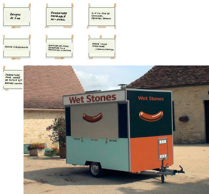
Kiosque Wet Stones, 2006, techniques mixtes sur châssis roulant, peinture acrylique, enseigne lumineuse, 277 x 394 x 178 cm. Pièce unique, production Les Ateliers des Arques, Les Arques, France

L'avancée du projet et les réactions des strasbourgeois seront à découvrir sur les réseaux sociaux