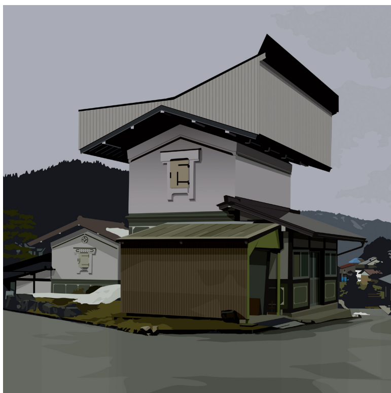
Alain Bublex, Paysage 258, grenier fantôme, 2016

Désireux de rendre les parkings de Strasbourg plus attractifs et plus vivants, Parcus, société d'économie mixte de stationnement sur le territoire de l'Eurométropole, cherche à créer un lien entre le parking et le quartier dans lequel il se situe. La démarche consiste à introduire l'art dans les parking en collaborant avec les acteurs culturels du quartier.