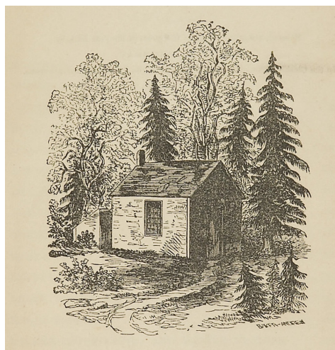
© Life in the woods , Henry David Thoreau, 1849

En plein XIX e siècle, dans le pays en passe de devenir le plus industrialisé du monde, Thoreau s'installe seul, dans les bois, dans une cabane qu'il construit lui-même. Son but ? « [Retrouver sa] demeure dans l'état où elle était il y a trois siècles », telle que celle-ci était avant l'irruption de l'homme blanc sur le sol américain. Entre le travail de ses mains et ses réflexions philosophiques, l'auteur développe une pensée critique de plus en plus élaborée sur la société dans laquelle il évolue. De ce mode de vie retranché sont inspirés aujourd'hui les mouvements zadistes. « Se positionner » n'aura jamais été aussi littéralement exprimé.