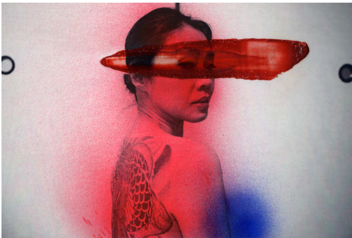
Chloé Jafé, Série I give you my life , 2023